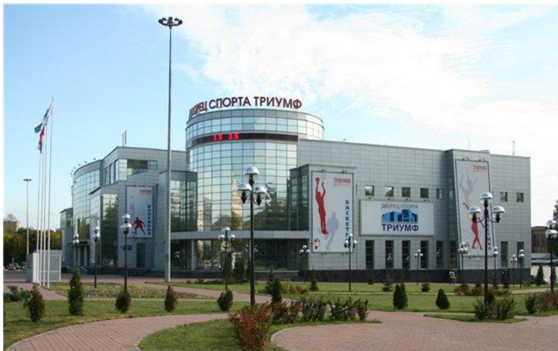
Вид спортивной арены Дворца Спорта "Триумф"