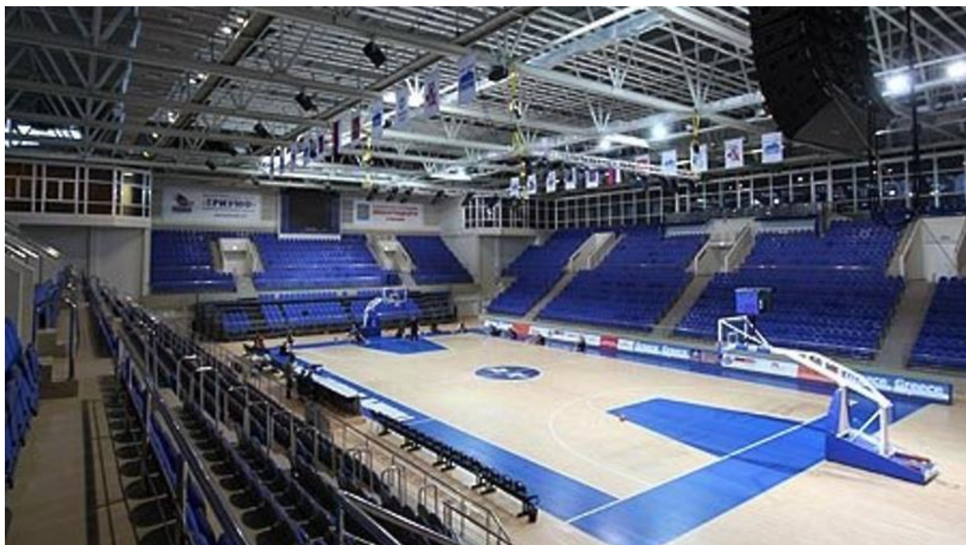
Расположение зрительских мест Дворца Спорта "Триумф"