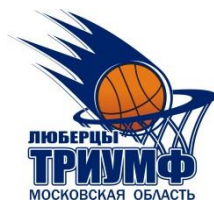
Дворец Спорта "Триумф" Московская область, г. Люберцы, улица Смирновская, дом 4